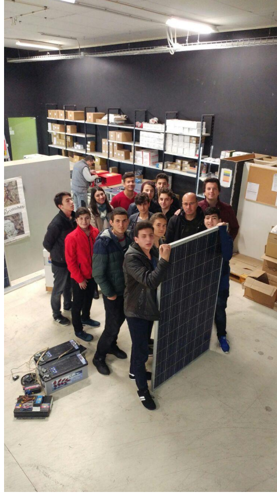
Öğrencilerimize panel montajı staj uygulaması öncesinde montajda kullanılacak akülerin güneş panellerinin ve şarj regülatörlerinin tanıtımı