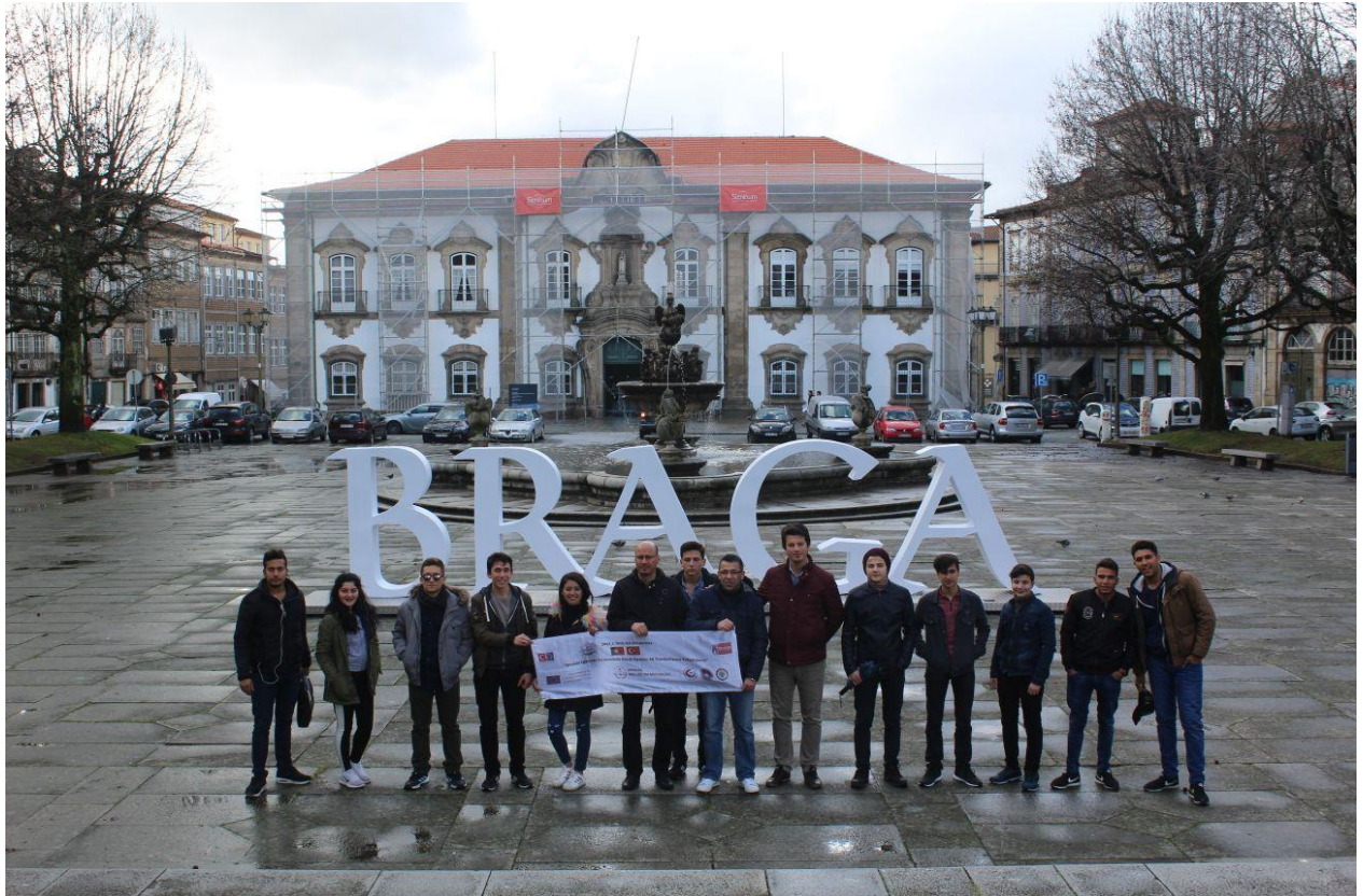
Kültürel gezimizden Braga Meydan- Kütüphane önünden çekilmiş bir hatıra resmi