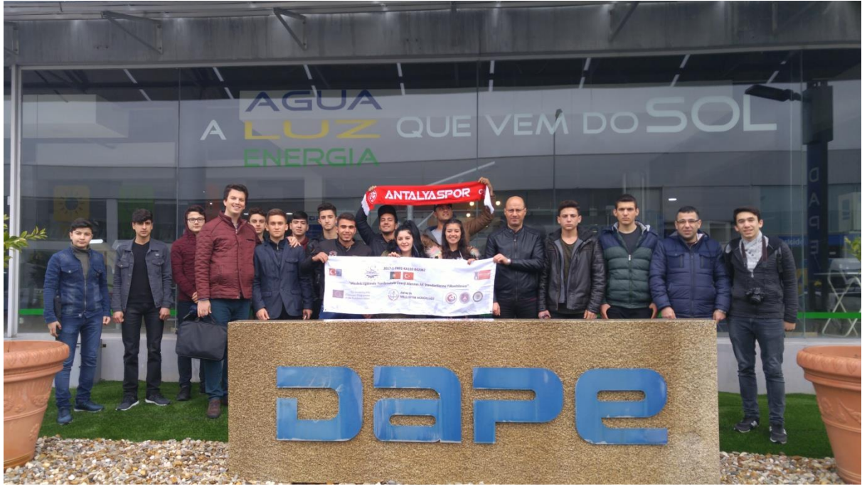
Staj yapacağımız firma olan DAPE binasının önündeyiz