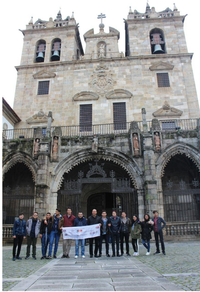
Kültürel gezimizde sıradaki durađını SE Katedrali