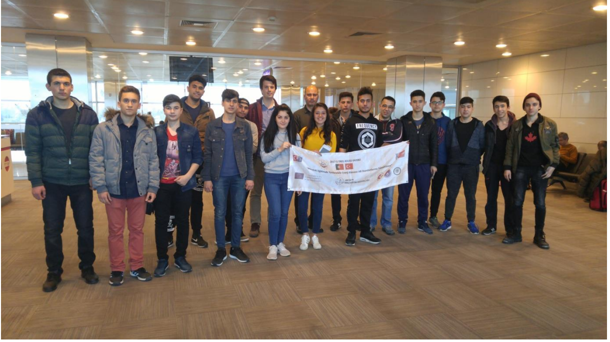
Portekiz yolculuğu öncesi İstanbul Atatürk Havalimanından güzel bir kare